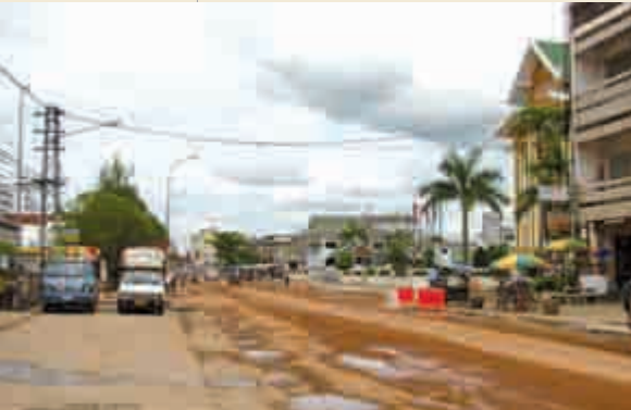
Imagen de Vientiane.

¡Ah, querida turista! –me contestó el mosquitero–, prométeme ante todo no ofenderte de que te llame así, en vez del término que sin duda preferirías de “viajera”, luego te explicaré por qué; y siéntate, pues te voy a contar una larga historia con la esperanza de que la publiques en Letras Libres , donde quedará que ni pintada junto a cualquiera de los artículos de la serie “Lo falso”, transcripción de otras tantas conferencias de un ciclo dirigido por mi admirado Enrique Lynch (dile sólo de mi parte que ya podía haber puesto a alguna mujer entre los conferenciantes) y que incluye “Lo falso en historia”, “Lo falso en arquitectura”, “Lo falso en filosofía”... pero no, que yo sepa, “Lo falso en decoración”, ¡y no será porque falten ejemplos!