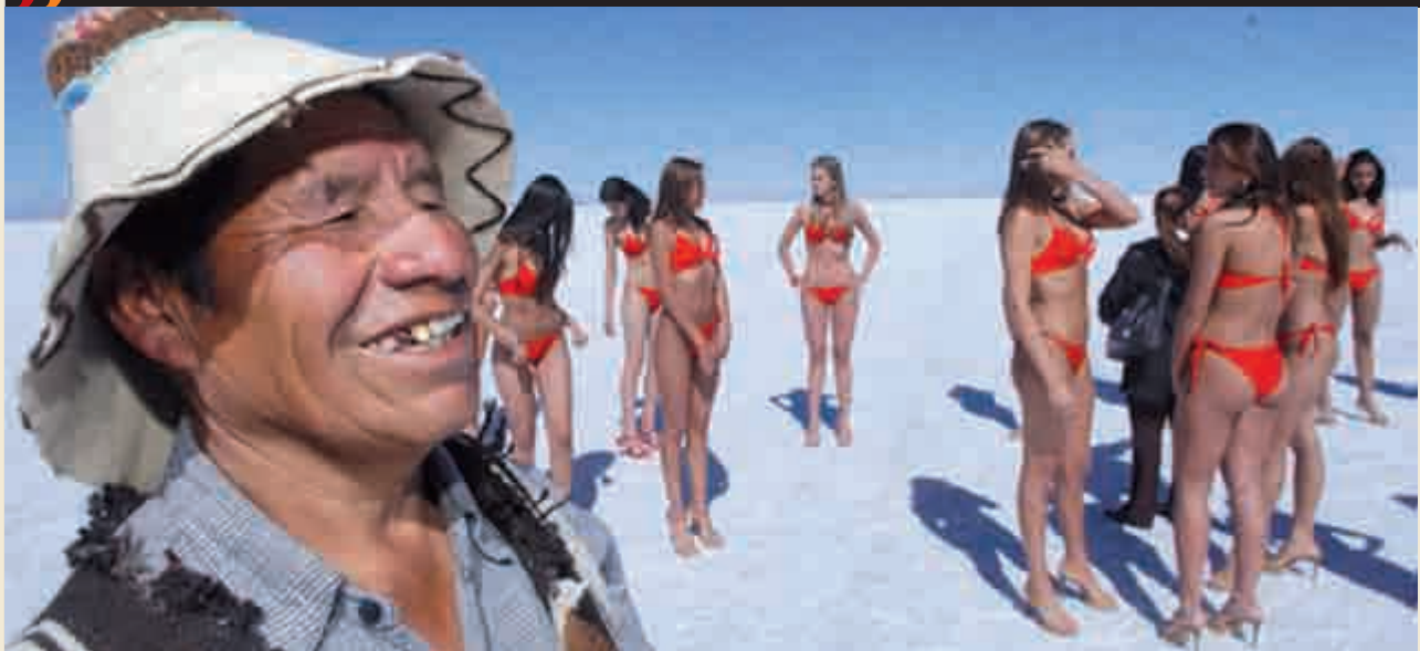
Bellezas en Bolivia.

pensar que, como dice el lugar común, la sangre llegaría al río: antes de irme, vi mucha sangre en el piso del salón. Había vasos tirados, platos rotos, gente que se golpeaba con denuedo. Una vez fuera del salón, mientras llegaba agitado al lugar donde unas amigas tenían aparcado el coche, pensé que todo había ocurrido por un simple concurso de belleza. Acababa de confirmar en carne propia que, en América Latina, los concursos de belleza son cualquier cosa menos simples.