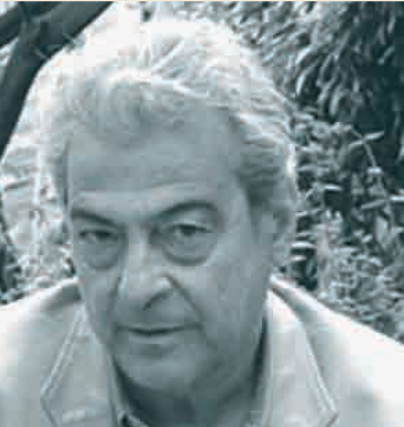
Antonio Cisneros (Lima, 1942).