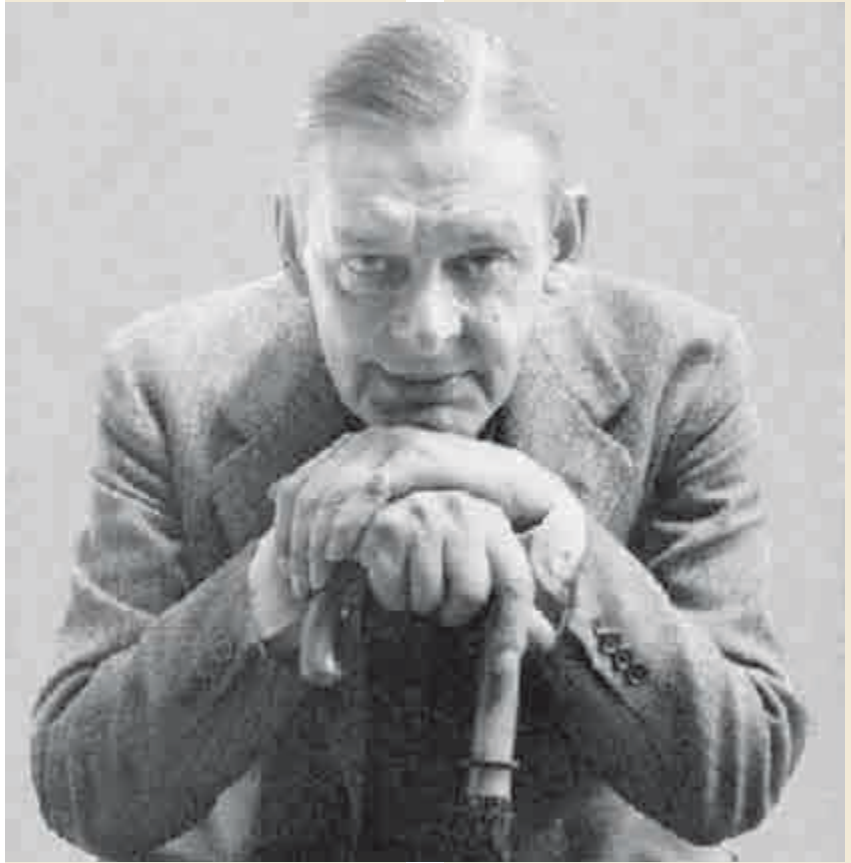
T. S. Eliot (St. Louis, Missouri, 1888-Londres, 1965).