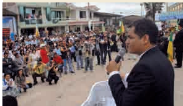
Rafael Correa (Guayaquil, 1963).

En el referendo celebrado el pasado 28 de septiembre, los ecuatorianos aprobaron con abrumadora mayoría (64%) la Constitución impulsada por el presidente Rafael Correa. Existen dos razones principales que explican este nuevo éxito electoral del mandatario. La primera, el hábil manejo discursivo y de comunicación gubernamental dirigido a asociar el proyecto constitucional con ese mágico concepto, el cambio . En este sentido, se presentó a la nueva Constitución como el pasaporte para abandonar el pasado, desterrar la “partidocracia”, la corrupción, la desigualdad; un boleto a la felicidad o, como dice el propio texto, al “buen vivir”. Más aún, la aprobación de la nueva Carta Magna sería un golpe certero a los odiados “pelucones” (término despectivo que Correa popularizó para referirse a la oligarquía), que tanto habían explotado al pueblo. Los alarmantes niveles de pobreza e inequidad que la mayoría de los ecuatorianos ha soportado históricamente en medio de una abundante riqueza natural explican la masiva aceptación popular a una propuesta de cambio profundo.