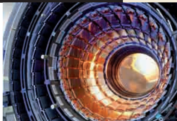
Imagen del túnel del colisionador.

Pero esas expresiones de radicalismo pueril no distraen a los científicos y técnicos, concentrados en mantener a punto la máquina y los múltiples detectores montados como capas de cebolla en los cuatro puntos ya mencionados. En particular, los investigadores e ingenieros españoles, mexicanos y griegos con los que hablé en estos días aprovechan al máximo la experiencia que, en algunos casos, llega a quinceaños, como la del