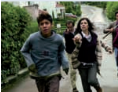
Escena de La zona .

La mayoría de las películas sobre enfermedades mentales gira alrededor de la creciente soledad del paciente, habitante de un mundo ahora desconocido, e incapaz de compartir con otros su percepción de la realidad. Lejos de ella , debut como directora de la actriz Sarah Polley, propone mirar el proceso—en este caso, la enfermedad de Alzheimer— desde el punto de vista del compañero abandonado. Julie Christie fue nominada al Oscar por su interpretación de una mujer que, en un lapso de treinta días, reemplaza a su marido de cuatro décadas por un compañero de asilo. Más interesante que la actuación de Christie es el tono desafectado, rayando en la parquedad, con que se trata un tema proclive al melodrama y al abuso sentimental. La austeridad elegida por Polley reviste de dignidad la decisión del protagonista de proveer a su esposa de todo aquello que sí tiene lugar en su