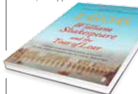
James Shapiro 1606. WILLIAM SHAKESPEARE AND THE YEAR OF LEAR Londres, Faber & Faber, 2015, 424 pp.